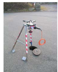
Stabilisatiesteunen met T-bediening